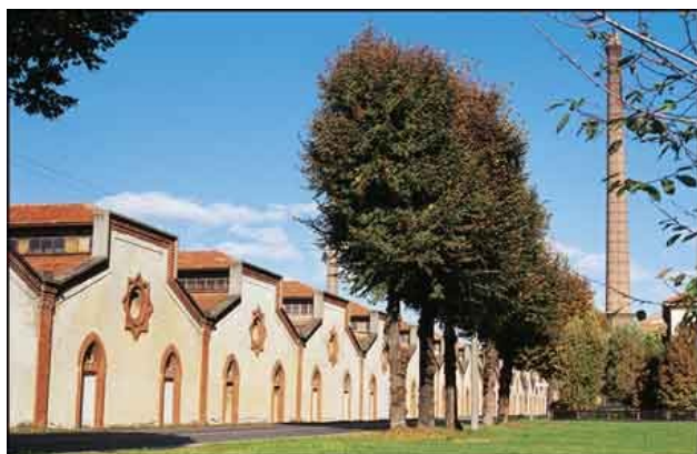
Esterno fabbrica con camino sullo sfondo

Fabbrica e villaggio di Crespi d'Adda furono realizzati a cavallo tra Otto e Novecento dalla famiglia di industriali cotonieri Crespi, quando in Italia nasceva l'industria moderna. Era questa l'epoca dei grandi capitani d'industria illuminati, al tempo stesso padroni e filantropi, ispirati a una dottrina sociale che li vedeva impegnati a tutelare la vita dei propri operai dentro e fuori la fabbrica. L'idea era di dare a tutti i dipendenti una villetta, con orto e giardino, e di fornire tutti i servizi necessari alla vita della comunità: chiesa, scuola, ospedale, dopolavoro, teatro, bagni pubblici... Nato nel 1878 sulla riva dell'Adda, in provincia di Bergamo, anche questo esperimento paternalista ebbe inesorabilmente termine - alla fine degli anni Venti con la fuoriuscita dei suoi protagonisti e a causa dei mutamenti avvenuti nel XX secolo. Oggi il villaggio di Crespi ospita una comunità in gran parte discendente degli operai che vi hanno vissuto o lavorato; e la fabbrica stessa è stata in funzione, sempre nel settore tessile cotoniero, fino al 2005.