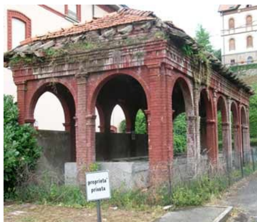
Lavatoio nelle vicinanze della chiesa